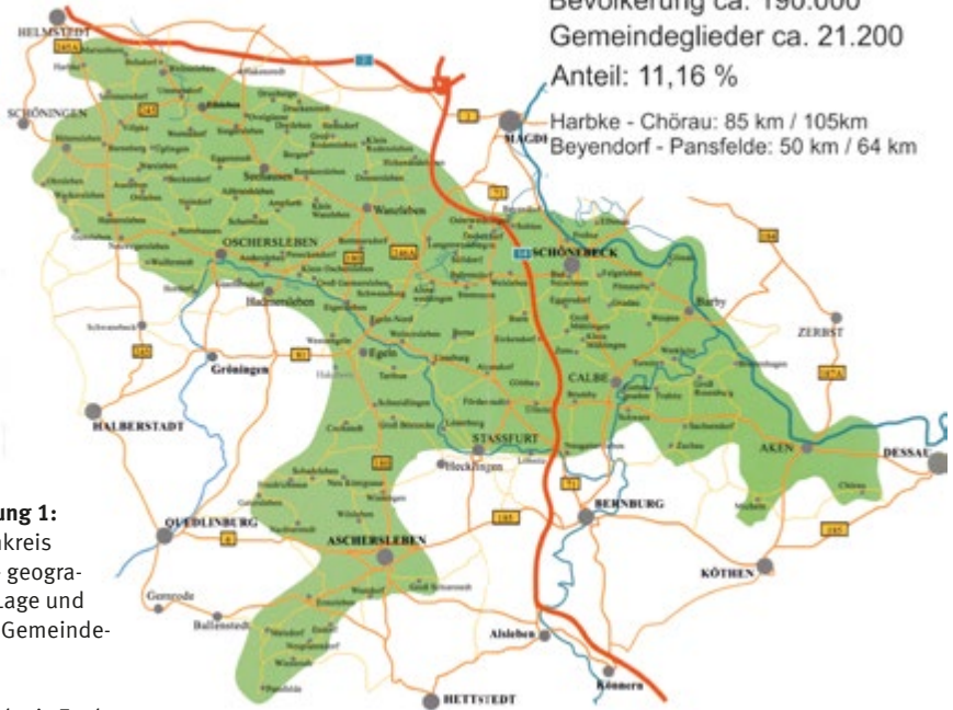
Abbildung 1: Kirchenkreis Egeln – geogra- fische Lage und Anzahl Gemeindeglieder