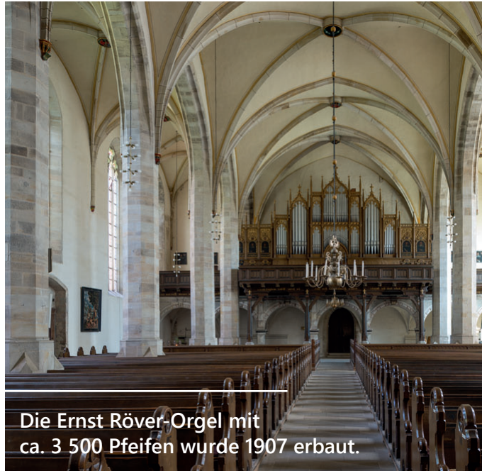
Die Ernst Röver-Orgel mit ca. 3 500 Pfeifen wurde 1907 erbaut.

Baugeschichte und Ausstattung der Kirche sind ein besonderer Schatz. Altarbilder aus der Werkstatt von Lucas Cranach dem Älteren (Ausschnitt siehe Titel oben) beeindrucken durch ihre Schönheit und ihrer Geschichte. Das Taufbecken von 1464 und die barocke Kanzel sind restauriert und erstrahlen im neuen Glanz.