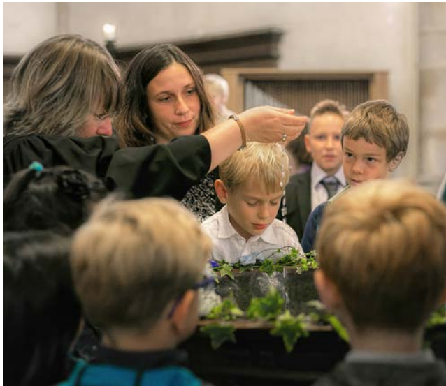
Taufe in St.-Stephanikirche 2017

Sie ist ein Ort für die Gemeinde, für Menschen, die suchen und finden. Hier feiern wir Gottesdienste, taufen Menschen, feiern Hochzeiten. Wir trauern und weinen, singen und lachen. Wir erzählen und hören von Gott und bitten um seinen Segen.